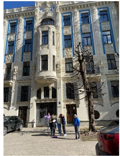
Alberta ielas arhitektūras pārsteidzošā pārbagātība; Skolas ielas un Strēlnieku ielas pērles.