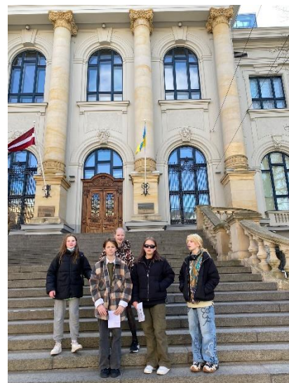
Latvijas Nacionālais Mākslas muzejs un Krišjāņa Valdemāra ielas jūgendstils